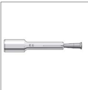
Kunkel anker KMu8 met binnendraad