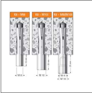
Kunkel anker K8 met binnendraad